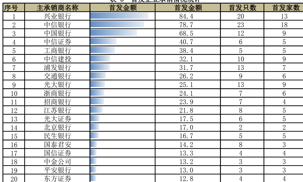
表 3 首发企业承销情况统计