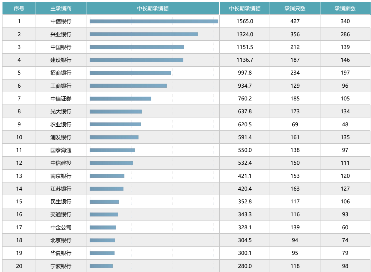
表1：中长期承销情况统计