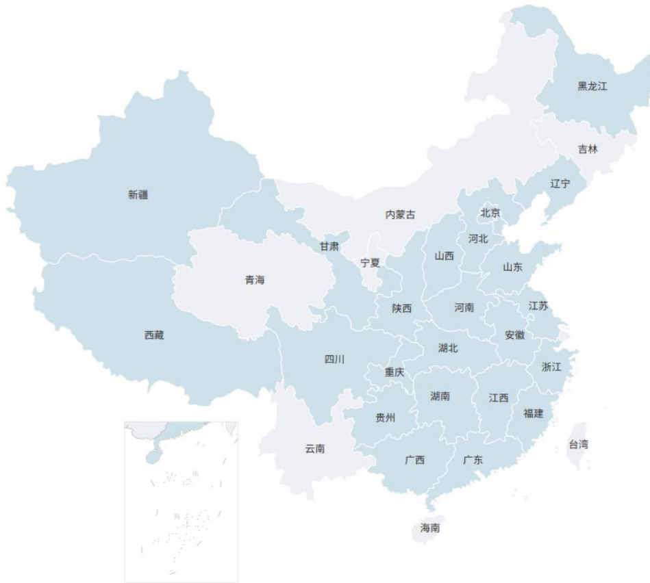
图表4 2023年9月30日中债信用增进公司信用增进业务累计开展项目区域分布